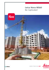
Leica Nova MS60