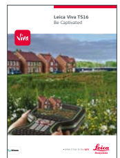
Leica Viva TS16