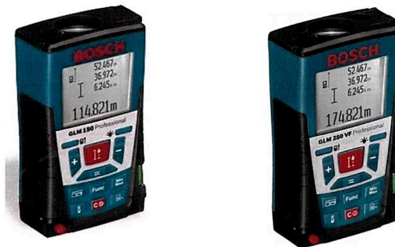
Рисунок 1 - Внешний вид дальномеров лазерных GLM 150, GLM 250 VF

Модификация GLM 250 VF Professional имеет встроенное оптическое визирное устройство (прицел), что обеспечивает точное наведение лазерного луча до измеряемых точек при больших расстояниях.