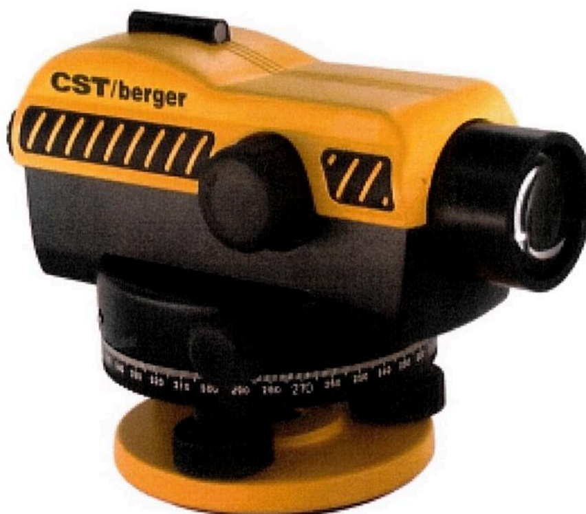
Рисунок 1 - Внешний вид нивелиров оптических CST/berger SAL20ND, CST/berger SAL24ND, CST/berger SAL28ND и CST/berger SAL32ND

По основным параметрам нивелиры соответствуют требованиям ГОСТ 10528-90, предъявляемым к группе технических нивелиров (CST/berger SAL20ND, CST/berger SAL24ND, CST/berger SAL28ND) и точных нивелиров (CST/berger SAL32ND).